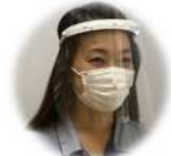
フェイスシールド